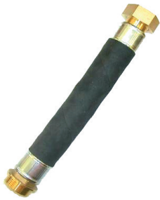
2 Stück Anschlusschläuche DN 32