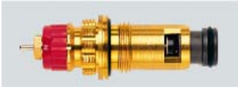
013 G 7370 / 1997 -