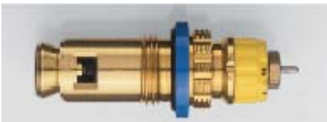
013 G 7483 seit 2001 Bezug nur über Heizkörperhersteller