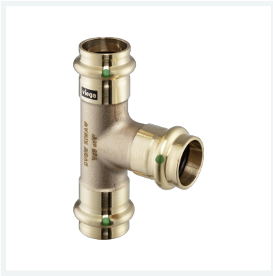
Sanpress-T-Stück mit SC-Contur Modell 2218 Artikel 106 614